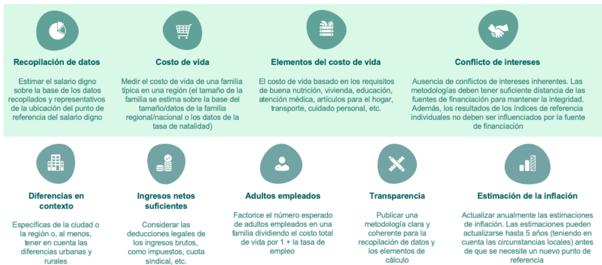
Ilustración 2 – Criterios del proceso de reconocimiento para las metodologías de salario digno